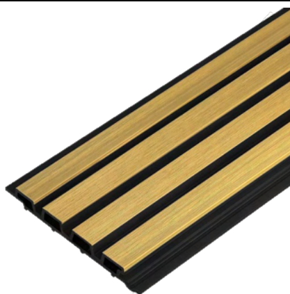
Dąb Jasny / Czarny